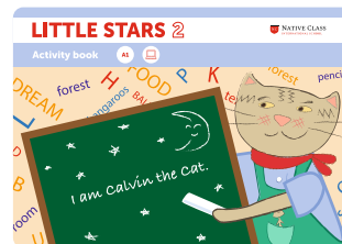
LITTLE STARS 2 ELEMENTARY (PART 1)