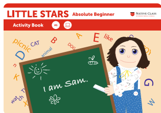
LITTLE STARS ABSOLUTE BEGINNER