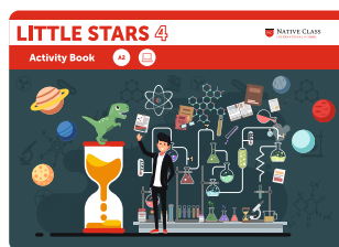
LITTLE STARS 4 PRE-INTERMEDIATE