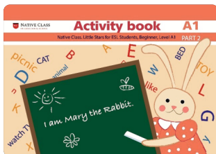
LITTLE STARS 1 BEGINNER