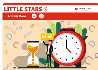
LITTLE STARS 3 ELEMENTARY (PART 2)